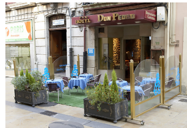
Hotel Don Pedro

Número de habitaciones: 69 Dirección: Calle la Fruta, 9, 33402 Avilés, Avilés - Asturias Teléfono: 985 52 57 54