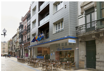
HO HOTEL CLASIFICADA HUIJOS

Número de habitaciones: 147 Dirección: Av de los Balagares, 34, 33404, Asturias Teléfono: 985 53 51 57