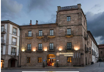
Palacio de Avilés Affiliated by Meliá *****

Número de habitaciones: 78 Dirección: Plaza España, 9, 33400 Avilés, Avilés - Asturias Teléfono: 985 12 90 80