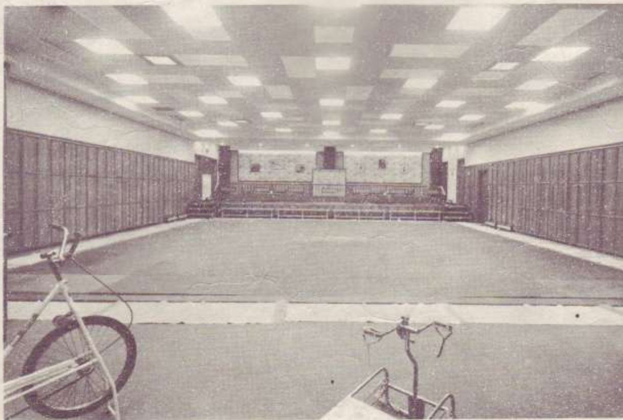
Una de nuestras instalaciones