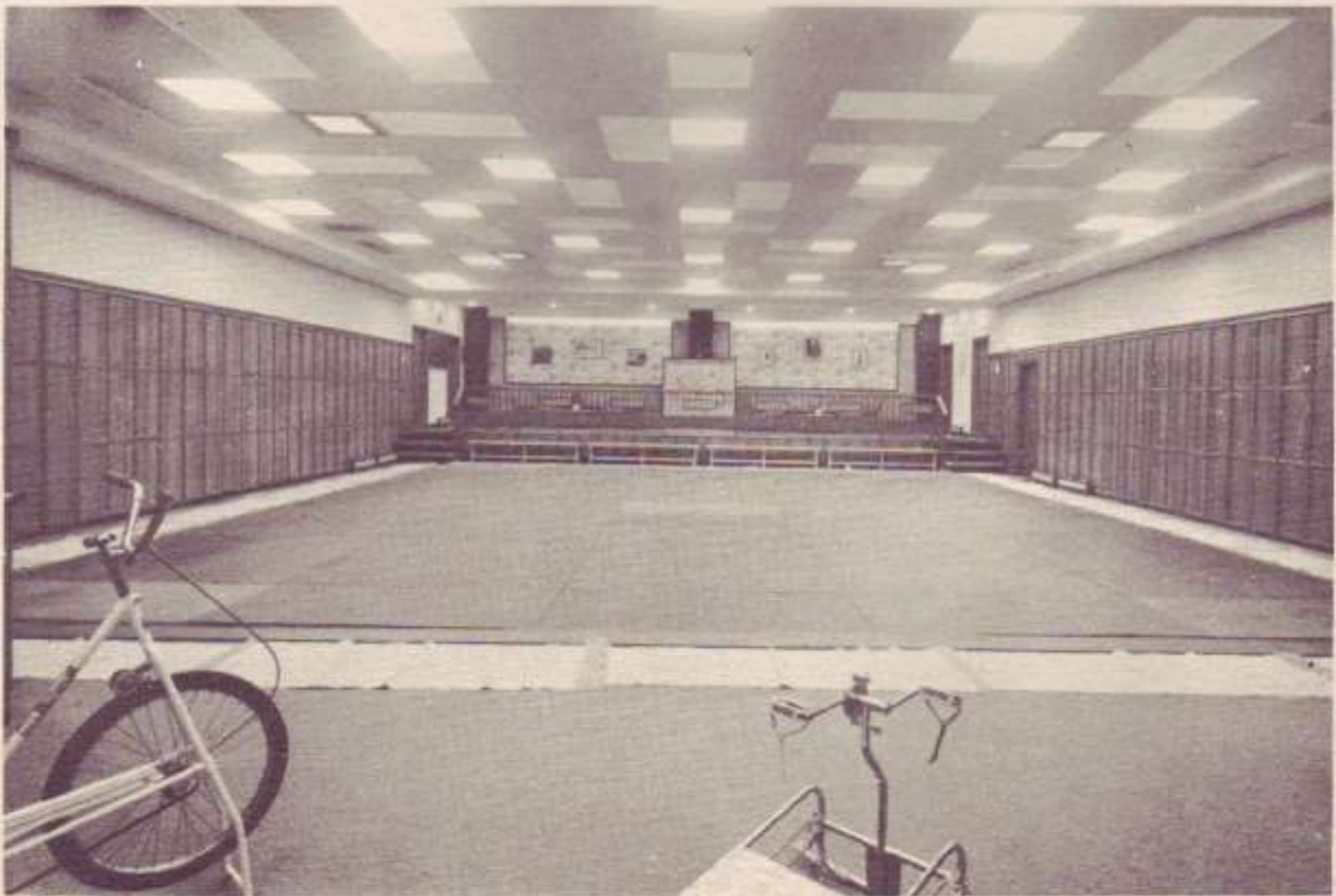
Una de nuestras instalaciones