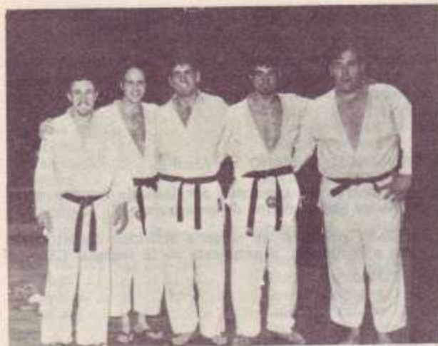
Equipo Castellano. Campeón de España 1969.