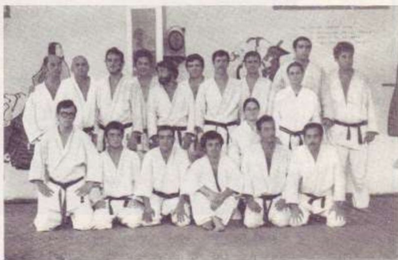
Grupo alumnos curso Monitores Judo, en Valencia