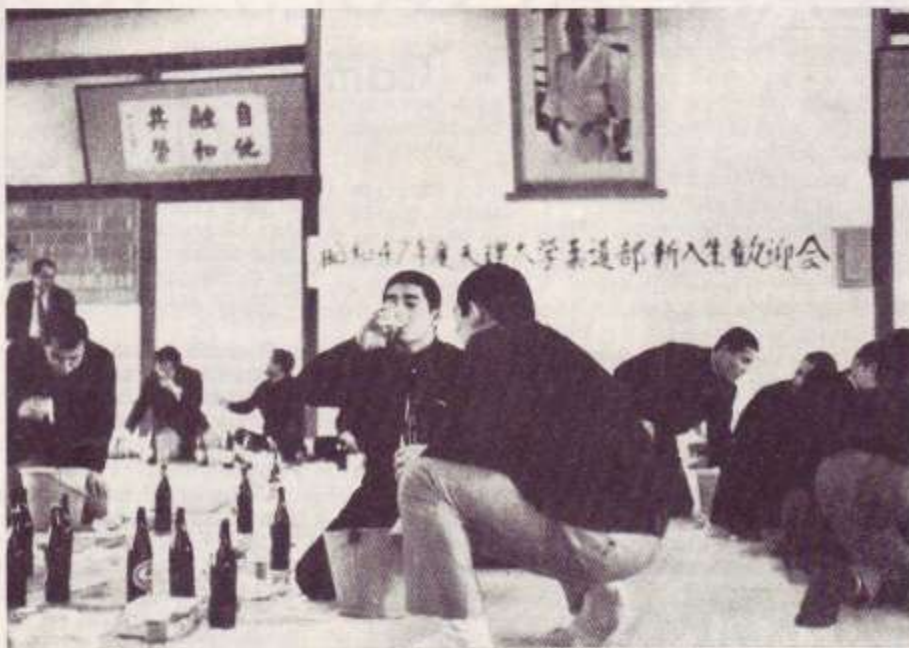
La recepción de los de primer año

Kodokan, cuya reputación ha sido excesivamente alabada y que, de hecho, se ha convertido en una gran sala comercial, donde se ejercitan muchos niños y ancianos, octavo y noveno dan, así como turistas extranjeros), descubrirán un mundo marginal, fábricas donde todo está organizado para crear campeones.