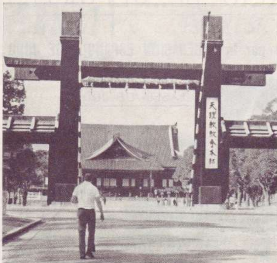
El gran Portal de la Universidad de Tenri

Por otra parte, en mi opinión, no es ya necesario acudir allí, pero esto no es cierto para los medios, los semipesados y los pesados, quienes una vez pasada la primera experiencia, deben volver para probar ese material humano de alto nivel, necesario para su progreso.