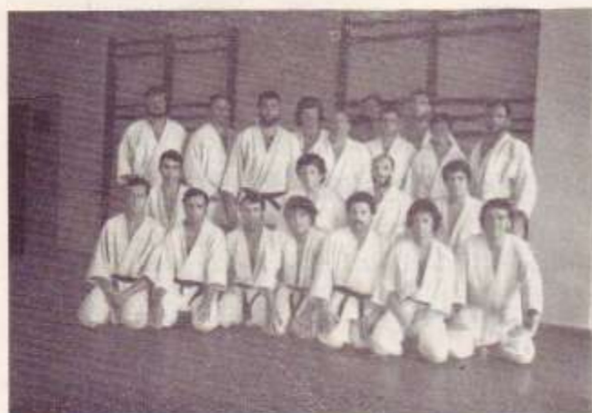
Grupo de mayores con los profesores

Suponemos, dado el éxito de estos cursos, que las Federaciones organizadoras proseguirán en esta magnífica labor cara a las vacaciones de nuestros judokas.