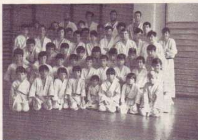
Grupo infantiles con los profesores