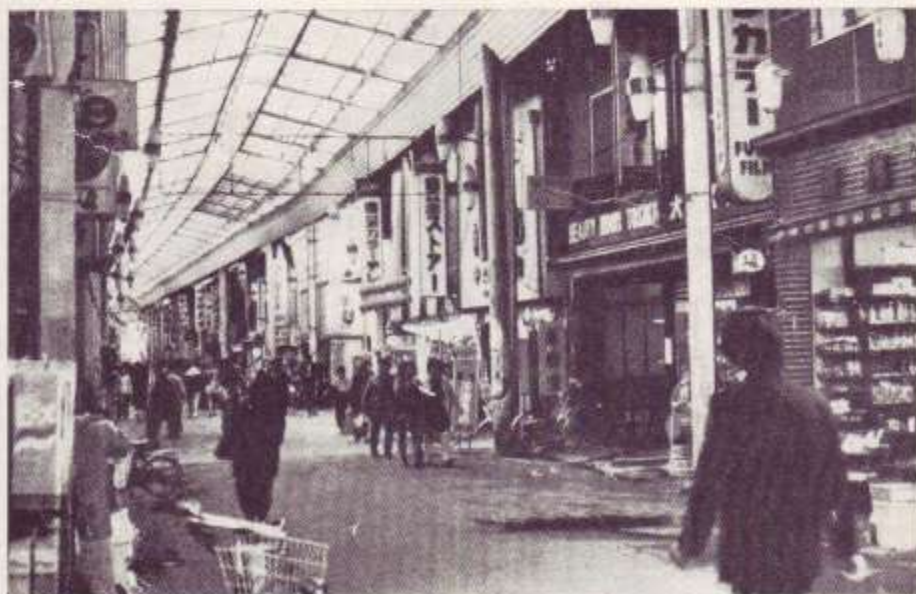
La "Hondori", la avenida comercial de Tenri

Entonces ¿qué ocurriría si usted, un joven francés, fuese al Japón para entrenarse? En primer lugar, para encontrarse en igualdad de condiciones con los japoneses, es preciso tener asegurados la alimentación y el alojamiento. Dos soluciones: o bien va solo y es una cuestión de dinero, pero la mayor parte de los franceses que van al Japón reciben además de sus medios personales, una beca de la Federación. O bien, pertenece a un grupo —mejor con un equipo de Francia o de jóvenes promesas francesas—, entonces todo está organizado, todo está pagado, y se encuentra en las condiciones japonesas, es decir, en las condiciones de máximo rendimiento: comer, dormir, entrenarse.