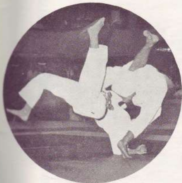
El magnífico punto que marca en el España-Japón