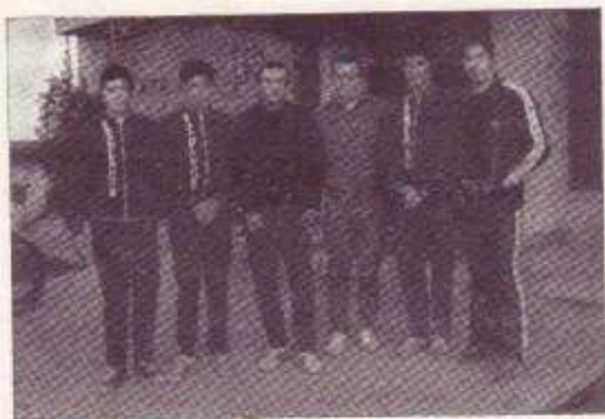
Equipo español en Tenri