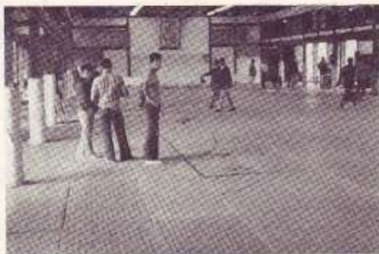
Tatami Universidad Tenri