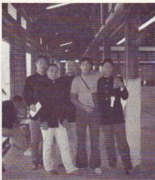
Compañeros de entrenamiento en Tenri (Japón)