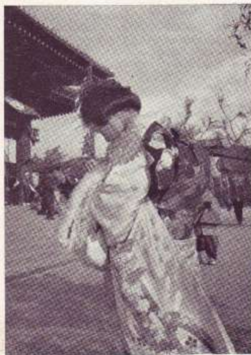
En el día de Año Nuevo.