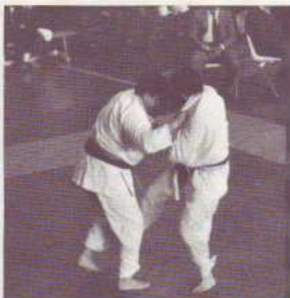
Cuatro momentos de los combates de los campeonatos castellanos. Los juniors fueron la sorpresa tanto por su combatividad como por su técnica.