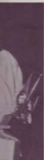
...co. 23 años; ...ración Caste ...ez que gana y ...do cumplidas