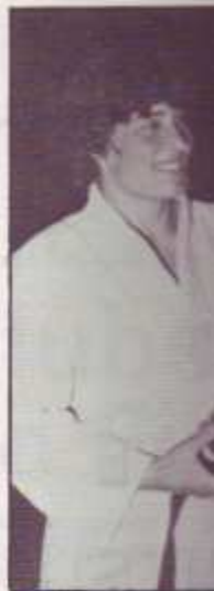
SEMIPESADOS: Apellido holandés casa. Federación 4ª vez que gana, y al Europeo, Mund

Vallisoletana, que terceras plazas, no stancia de su gran