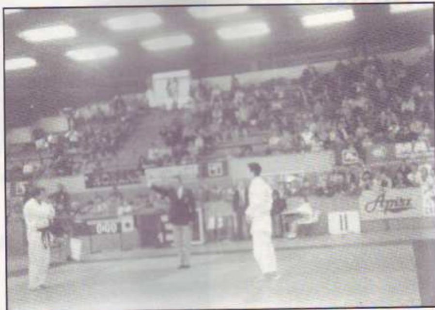
LA DECISION FINAL, QUE DIO LA MEDALLA DE ORO A ESPAÑA

—El oro de Budapest ha llegado en un gran momento. A partir de ahora, todo cambiará, puede suceder que pierda, pero el triunfo ya lo he tocado y sé que puedo volver a lograrlo. Mi mentalidad será, a partir de ahora, diferente.