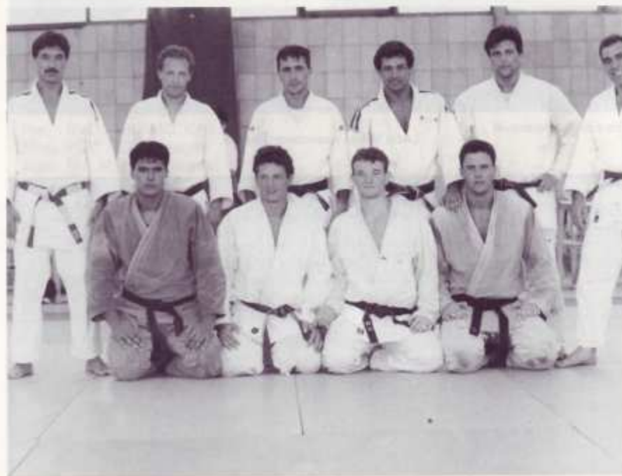
Equipo Nacional Masculino en el Campeonato del Mundo.