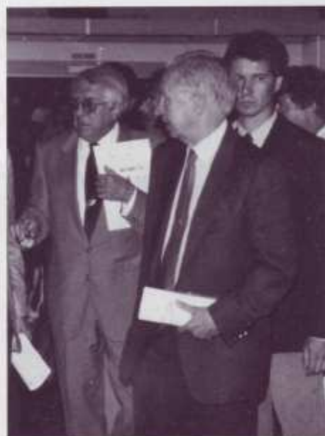
Juan Antonio Samaranch Presidente del C.O.I. espectador de excepción.

El apoyo que han prestado a la organización todos los Organismos Oficiales: C.O.I.,