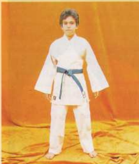
100 Judo normal

EL KIMONO MARCA TAGOYA HA SIDO HOMOLOGADO POR LA FEDERACION ESPAÑOLA DE JUDO Y TIENE LAS MEDIDAS REGLAMENTARIAS EXIGIDAS POR LA F.I.J.