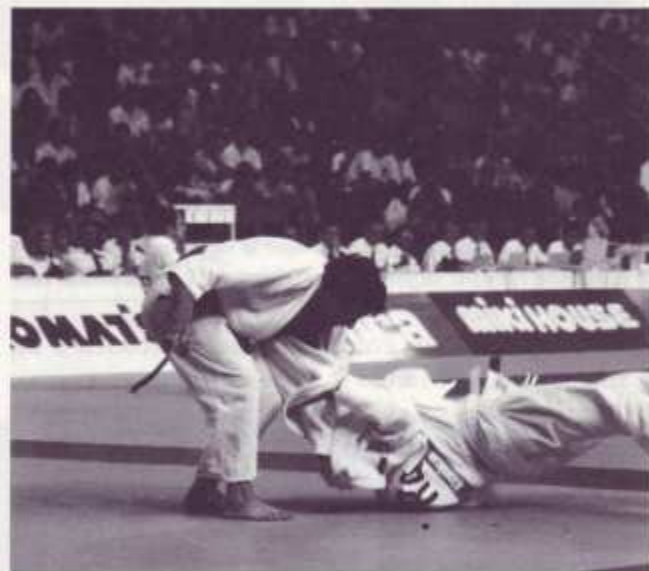
Ippón de Quino sobre Rosso (Francia).

A todos ellos desde estas líneas les ruego que me perdonen cuando les he fallado y les agradezco su apoyo y comprensión en todo momento, su amistad, su ayuda,