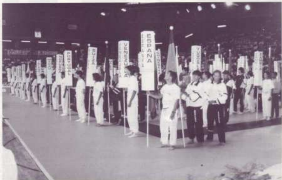
Representación española en el desfile inaugural.