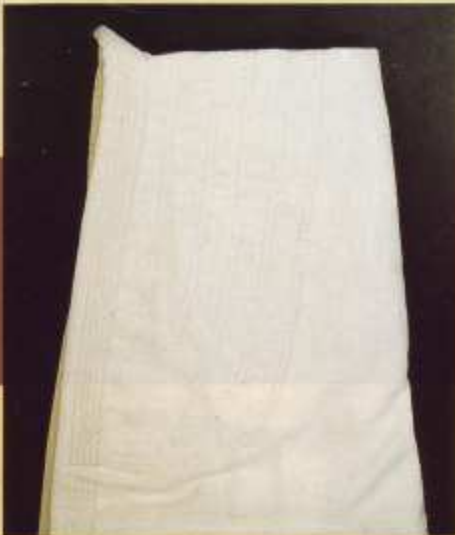
125 Judo competición

EL KIMONO MARCA TAGOYA HA SIDO HOMOLOGADO POR LA FEDERACION ESPAÑOLA DE JUDO Y TIENE LAS MEDIDAS REGLAMENTARIAS EXIGIDAS POR LA F.I.J.