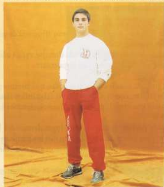
550 Sudadera serigrafía judo