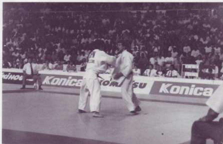
Quino y Koga en la final.