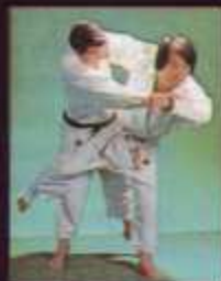
Producción y dirección: PEDRO RODRIGUEZ DABAUZA