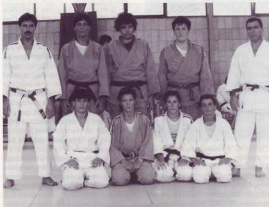
Equipo Nacional Femenino en el Campeonato del Mundo.

En cuartos de final le correspondió enfrentarse a la durísima francesa BOFFIN. De Boffin se puede esperar de todo, ha ganado a todo el mundo, ha conseguido medallas a todos los niveles, su técnica (es-