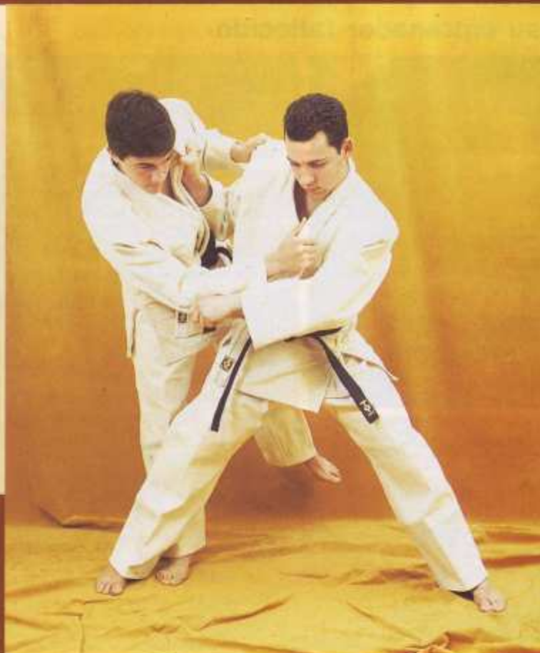
125 Judo competición