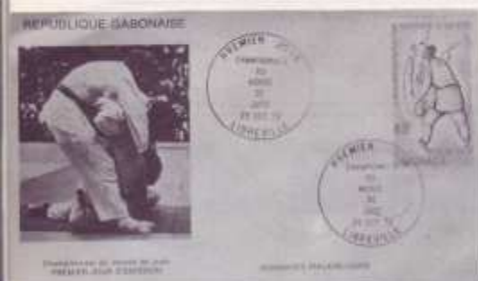
Interesante composición Gabonesa de sello, matasello y sobre alusivo.