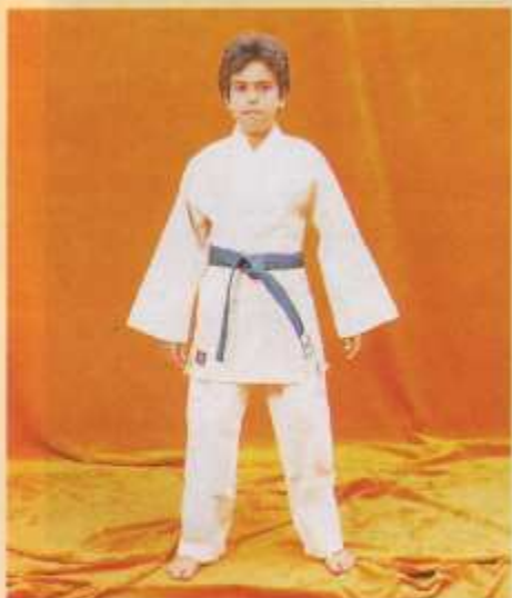
100 Judo normal

EL KIMONO MARCA TAGOYA HA SIDO HOMOLOGADO POR LA FEDERACION ESPAÑOLA DE JUDO Y TIENE LAS MEDIDAS REGLAMENTARIAS EXIGIDAS POR LA F.I.J.