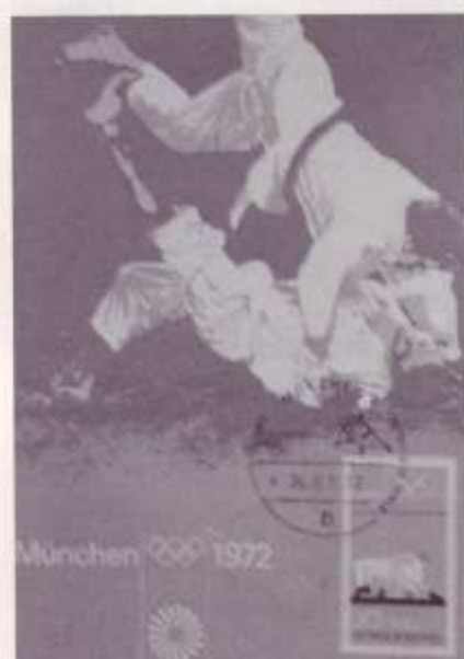
Tarjeta máxima (postal), matasello de judo y sello de lucha.