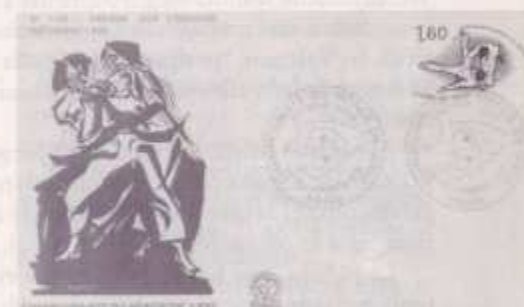
No podía faltar Francia, su Campeonato del Mundo de 1979 lo festeja con sobre, matasellos y sello, de judo futurista, eso sí.

Todo buen coleccionista debe atender a todos estos tipos pues en nuestro caso, si se han emitido hasta nuestros días 120 sellos de Judo con tener dinero