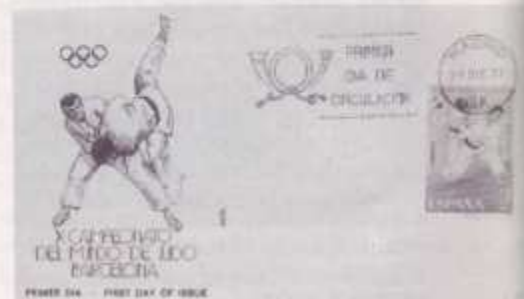
Algo que no pudo ser, pero ahí quedó para el recuerdo y el interés filatélico (sello y sobre).