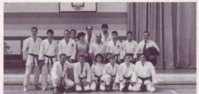
Jiu-Jitsu. Torrejón de la Calzada, 11 y 12 julio 1992: Monitores y C. N. aprobados de Castilla La Mancha.