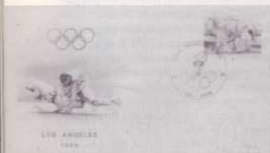
Preciosa combinación belga de sello y sobre.

Animados por la curiosidad que ha suscitado nuestro primer artículo, seguiremos informando sobre las particularidades de este tema al que llevamos dedicando mucho tiempo y que esperamos un día hacer donación, de