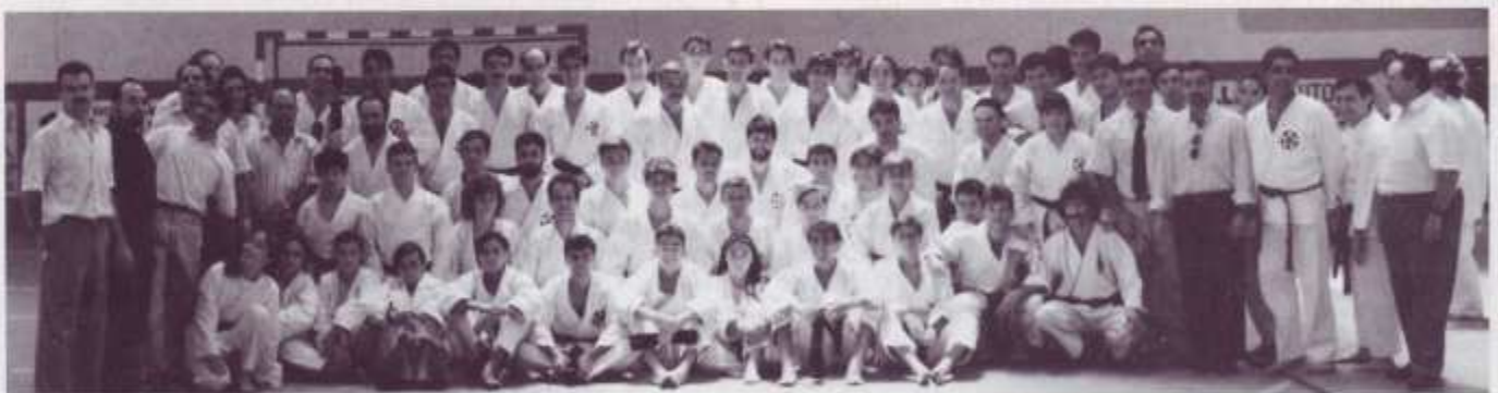
Jiu-Jitsu. Torrejón de la Calzada: Profesores y alumnos de los cursos de monitor, arbitraje y cintos negros.