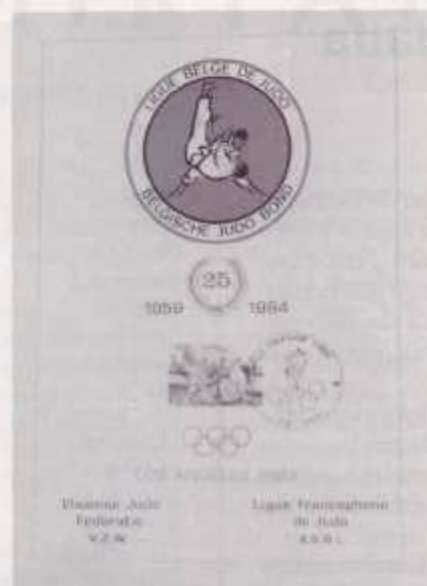
Éste es un precioso efecto postal que sólo ha emitido Bélgica.

una colección muy entrañable, a los fondos de la FEJYDA.