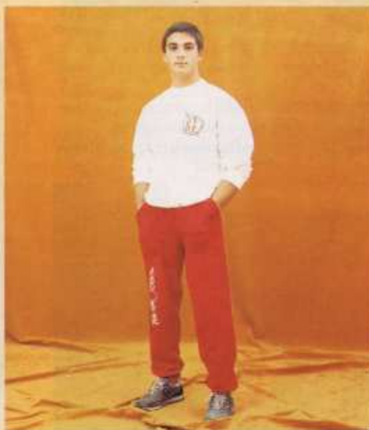
550 Sudadera serigrafía judo