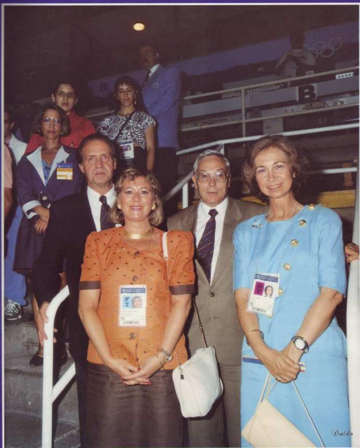
SS. MM. apoyaron e impulsaron con su presencia los éxitos del Judo español.