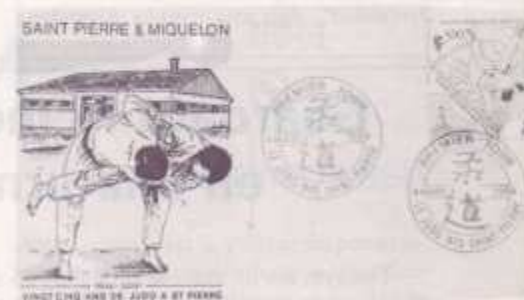
¿Saben donde queda San Pedro & Miquelon? pues ellos celebran el judo con un maravilloso ejemplar de sobre, matasellos y sello.

LA TARJETA MÁXIMA (Tarjeta Postal para entenderse).