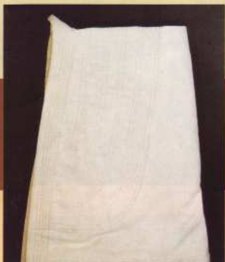
125 Judo competición

EL KIMONO MARCA TAGOYA HA SIDO HOMOLOGADO POR LA FEDERACION ESPAÑOLA DE JUDO Y TIENE LAS MEDIDAS REGLAMENTARIAS EXIGIDAS POR LA F.I.J.