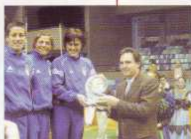
Equipo de Italia recibiendo el trofeo de Feliciano Mayoral, de Madrid 2012