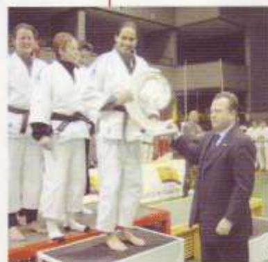
Equipo de Bélgica recibiendo el trofeo de Marius Vizer, presidente de la UEJ