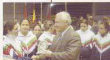
Equipo de Portugal