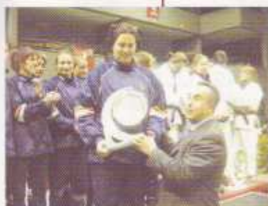
Equipo de España recibiendo el trofeo de Alejandro Blanco, presidente de la REFE