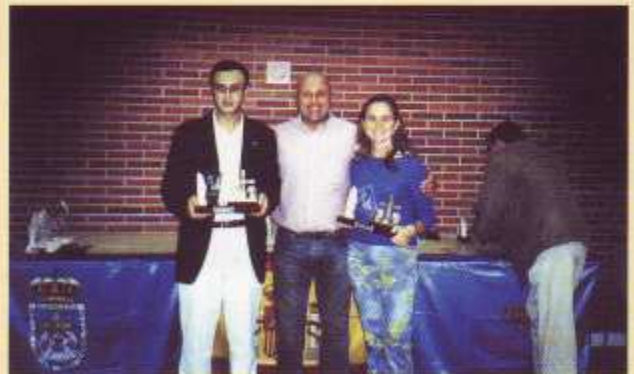
El organizador del evento entrega Trofeos a los representantes del Ayto. de Oviedo y Consejería de Deporte y Cultura.

El nivel fue altísimo dada la representación asistente, con combates dignos de la final de cualquier Cto. de España. El trofeo se desarrolló desde las 16:00 hasta las 19:30 h. entregándose los trofeos a continuación, dando por finalizada la competición a las 8 de la tarde.