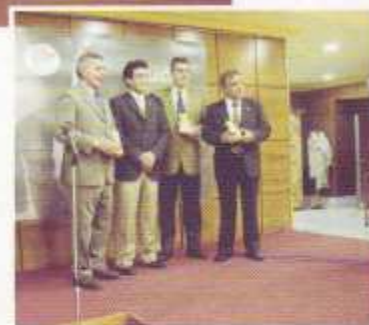
Ganadores de los distintos galardones a los mejores deportista gallegos 2002