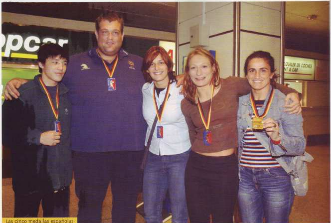
Las cinco medallas españolas