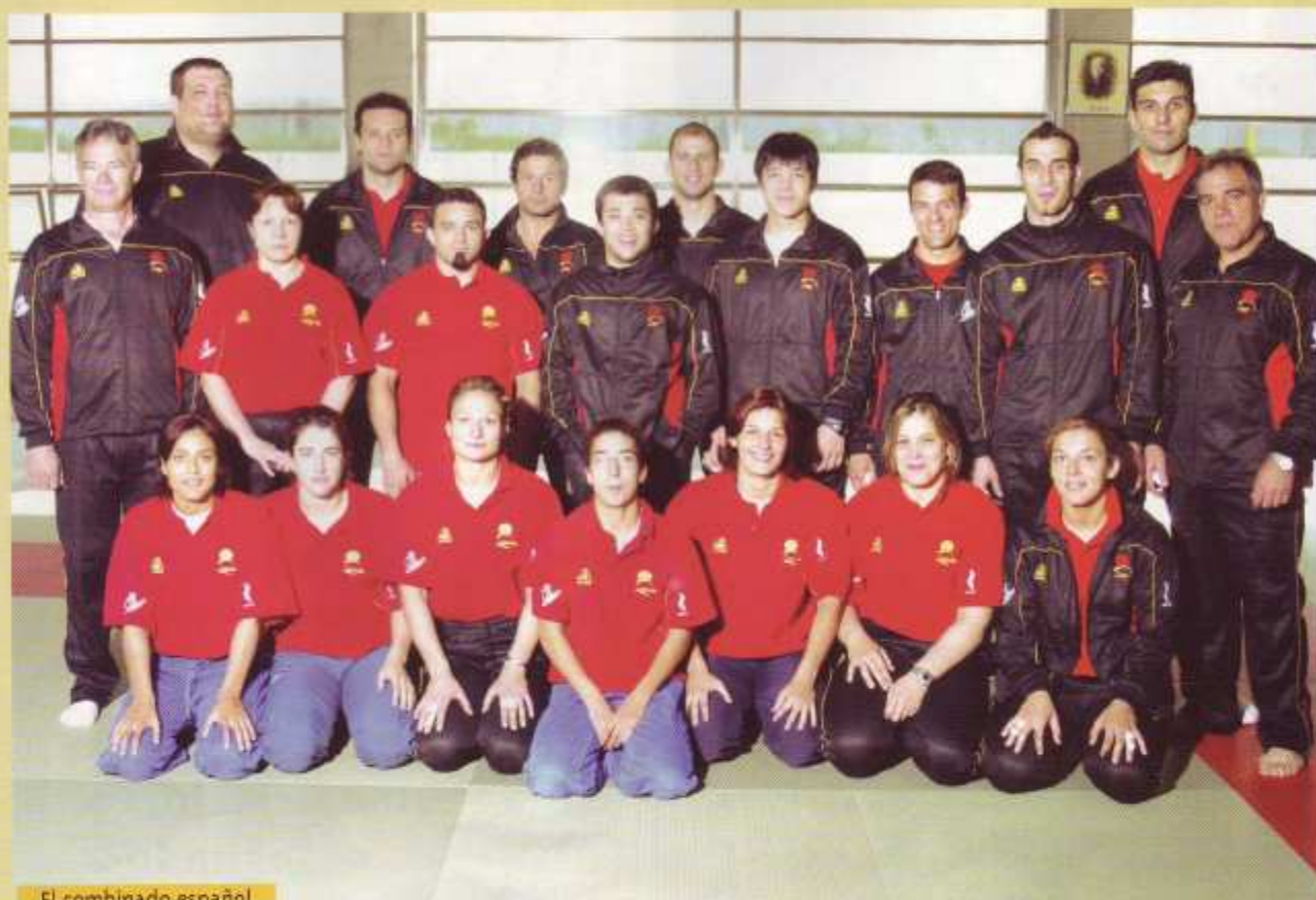
El combinado español